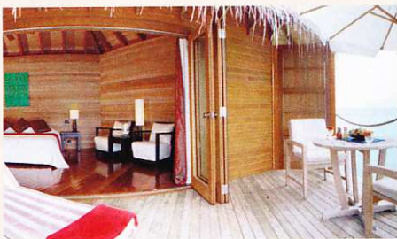
Overwater-Bungalow des »Mirihi Island Resort«

Sie wollten schon immer einmal auf die Malediven? Schnell da sein, einfach nur relaxen und wenn es nur für eine Woche ist? Schickimicki-Publikum brauchen Sie nicht und im Paradies verzichten Sie auch gern auf Fernsehen, Socken und Schuhe? Dann fliegen Sie doch einmal nach Mirihi! Dort fühlen Sie sich wie ein Robinson, der es zu etwas gebracht hat. Selbst im Restaurant liegt feiner Pudersand. Das Hausriff ist